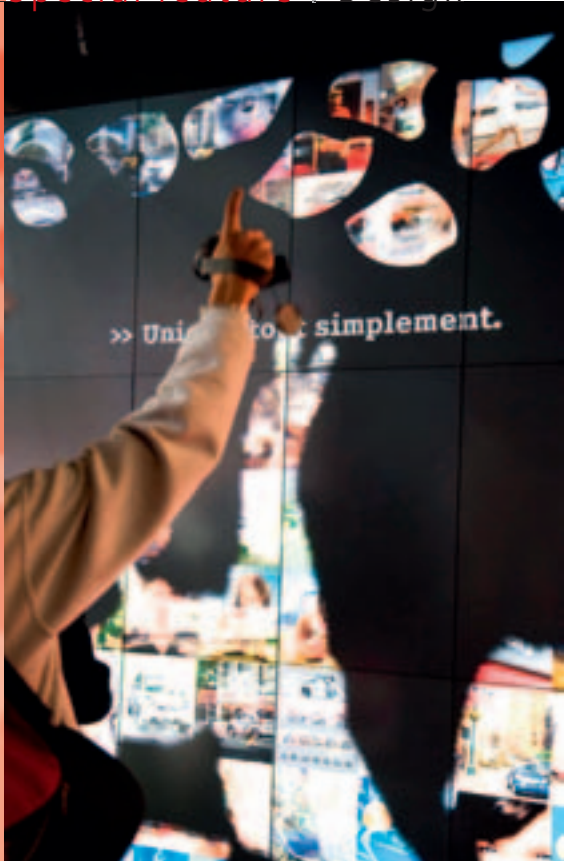
If interactive stations are created and then integrated into the stand concept, communication is working and the brand appearance is convincing.

viewed on more than 40 partner stands." Visitors were presented with information in the form of interactive touchtables, application films and printed information. Multimedia is expanding fast in the presentation of exhibits, observes Anke Goeres of Expotec, Mainz. "With multimedia installations, background information can be conveyed faster, simpler but with more substance. Take the example of Deutsche Telekom at Cebit in Hanover (concept: Atelier Markgraph, Frankfurt): No product to be