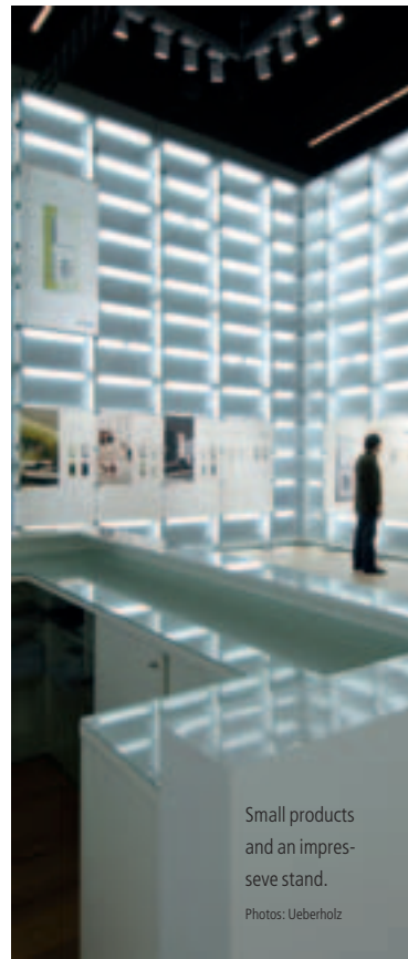
Small products and an impressive stand.