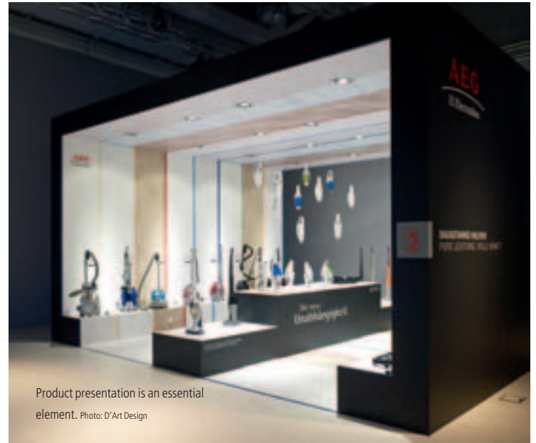
Product presentation is an essential element.