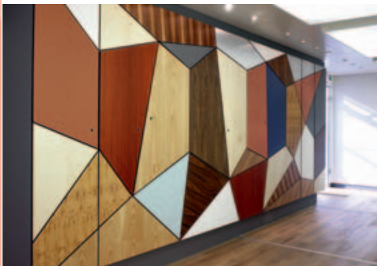
The trade fair architecture design is motivated by the product or product idea.